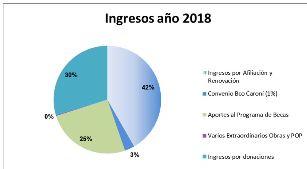
Gráfico 1: Partidas de Ingresos en el periodo del 01-01-2018 al 31-12-2018

Durante el periodo 01-01-18 al 31-12-18 el ingreso fue de Bs. 348.854,35 y los egresos alcanzaron la suma de Bs. 211.076,19, con un resultado positivo de Bs. 137.778,16. A pesar que las afiliaciones disminuyeron con respecto al periodo anterior, se incrementaron los ingresos por renovaciones, donaciones y aportes al programa de beca a un estudiante UCV. Todo esto en términos de bolívares nominales.